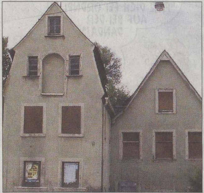
Zum sanierungswerten Potenzial in Hof gehören nach Ansicht der Hof-Architekten zum Beispiel der Alte Poststall im Sigmundgraben ...

Doch auch in Hof gibt es, wie die Hof-Architekten mit einem virtuellen Stadtrundgang zeigten, positive und negative Beispiele im Stadtbild. Qualität zeigte sich, so der Vortrag, etwa bei der gelungenen Gestaltung des