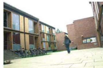
Modernität statt Eklektizismus; Studentenwohnheim Hof

Der Bestandserhalt und die Modernisierung von Gebäuden ist ein wichtiges Zukunftsthema - gegen Zersiedelung und Flächenverbrauch und für innovative Lösungen im Bestandssektor - BAUEN IM BESTAND und NEUER NUTZEN IN ALTEN INDUSTRIEBAUTEN.