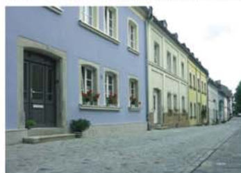
Wohnen findet innen statt; Mühlberg in Hof

Dies betrifft die Aspekte Städtebau und Grünbereiche, Baudenkmäler und Ensembles, aber auch Neubau und Sanierung im Detail.