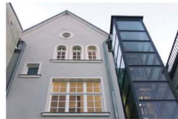
Bauen im Bestand; Rücker Apotheke Hof

Unter dem Stichwort Wohnen findet INNEN STATT sind die Vorteile innerstädtischen Lebens zu nennen - alle wichtigen Funktionen wie Schulen, Einkaufsmöglichkeiten, öffentliche Einrichtungen und Freizeiteinrichtungen sind fußläufig zu erreichen. Die verdichtete Bauweise ist energiesparend, die innerstädtischen Quartiere bieten aufgrund ihrer historischen Substanz Qualität und Ästhetik.