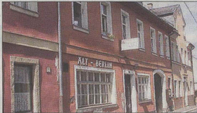
... oder auch dieses Haus in der Auguststraße

an der Saale. Gebäude mit großem Sanierungspotenzial seien dagegen beispielsweise der Alte Poststall im Sigmundgraben oder auch die Gaststätte „Alt Berlin“ in der Auguststraße. Weitere Beispiele dokumentieren die Architekten in einer Postkarten-Serie, die in der Sparkasse zu sehen ist. „Es gilt“, so Kathrin Buchta von den Hof-Architekten, „die Sinne zu schärfen, um Qualitäten und Potenziale in der Stadt Hof und der Umgebung zu erkennen, zu fördern und zu entwickeln.“ K. St.